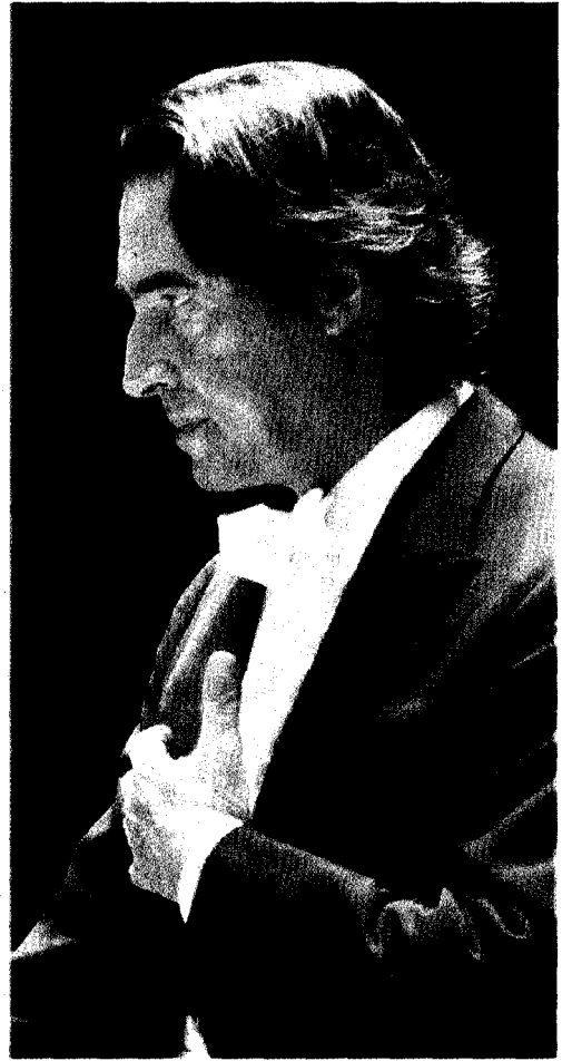
All'opera. Riccardo Muti