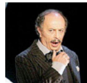
Leo Nucci, Miller Il baritono più amato dai parmigiani, tecnica impeccabile e navigata recitazione