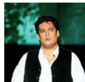
Marcelo Alvarez, Rodolfo Già visto al Regio come il Manrico del Trovatore, canta con voce brillante e decisa