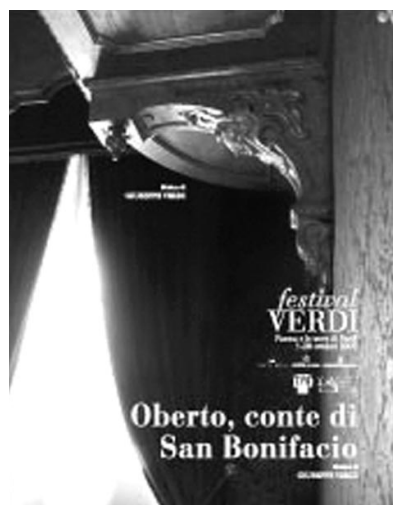
Nelle foto il teatro di Busseto Il manifesto dell'Oberto e Giuseppe Verdi