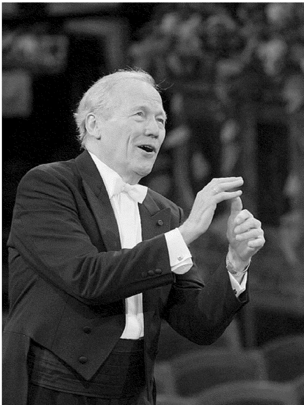
Il direttore Georges Prêtre