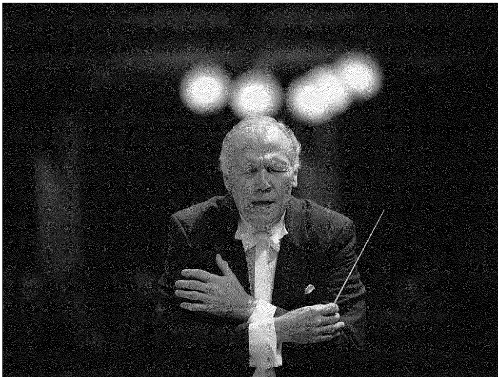
Talento Georges Prêtre recentemente è stato nominato Commandeur de la Légion d'Honneur.