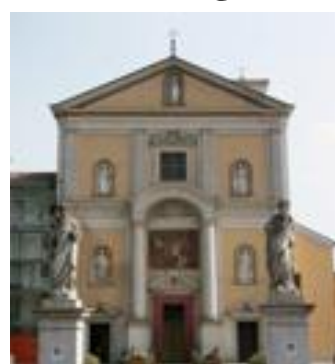
La chiesa parrocchiale di Brembio

Sopra il portale maggiore della facciata, posto fra due colonne e sormontato da un arco, è dipinto un affresco raffigurante la Nascita di Maria ; sempre sulla facciata si aprono quattro nicchie con le statue degli evangelisti, mentre la sta-