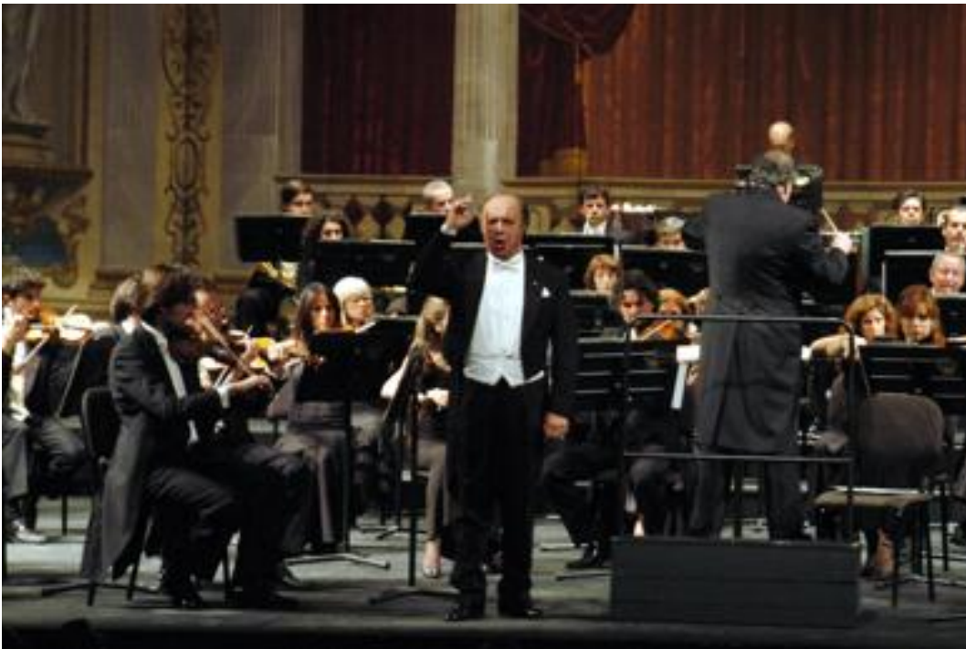
Leo Nucci in un momento dell'applaudito concerto di mercoledì al Teatro Regio di Parma

la Scala diretta da Daniele Gatti. Fuori dal teatro, negozi, bar, piazze addobbate con costumi di rappresentazioni verdiane. Una città che canta, verrebbe da dire, e che chiama a sé il mondo, dai giornalisti ai vip, dagli appassionati alle televisioni dei cinque continenti. Parma capitale della musica. E come una vera madre, sa coccolarlo come nessuna i suoi figli prediletti. La Nucci soirée doveva essere lo scorso 3 ottobre, invece una pura casualità l'ha fatta slittare in coda. Ci piace cogliere, in questo fuori programma, il segno di una benedizione; come se a sancire l'ultimo volo