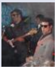
La band degli Statuto

Prosegue il tour di presentazione del nuovo disco degli Statuto. Domani la band "ska" si esibisce al Buddha Café di Orzinuovi e naturalmente al centro del concerto ci saranno i 14 brani che compongono l'album "Come un pugno chiuso". Solo uno, "Se tu se lei" è inedito, gli altri sono cover straniere rivisitate e cantate in italiano. Al pubblico di fan il gruppo torinese sottopone questo esperimento e non manca la curiosità di vedere quale tipo di riscontro ne potrà derivare. Non mancheranno le canzoni più note di una carriera iniziata nel 1983.