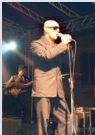
Giuliano Palma, "the king", sul palco

Da quando è uscito il loro ultimo album, intitolato "Bogaloo" in omaggio al genere che indica una commistione tra pop, ska, rock, reggae, sono saliti ancora di più sulla cresta dell'onda. A raccogliere i frutti di una crescita inarrestabile ha giovato senza ombra di dubbio il fortunato singolo di anticipazione del disco, la cover di "Tutta mia la città" dell'Equipe 84. Non è difficile prevedere che domani sera tutti la canteranno a squarciagola al Fillmore di Cortemaggiore, ennesima tappa del tour promozionale di "The King" Giuliano Palma and the Bluebeaters. Sarà una serata di cover, una addirittura dei Beatles di "I'll Get You". Poi ci sarà spazio per il vecchio repertorio della band di Giuliano Palma, capace di spaziare tra generi diversi all'insegna del ritmo. In primo piano, ovviamente, lo ska e lo swing; ancora una volta verranno rivisitati per regalare un concerto divertente.