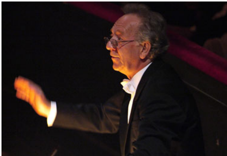
Il direttore Yuri Temirkanov

Non sono stati molti, tra i grandissimi direttori, quelli che hanno scelto di cimentarsi in Traviata , e sono pochi quelli di cui ci resta, in quest'opera, un lascito discografico, in studio o dal vivo. Non c'è da stupirsi: nonostante la presenza dei due più famosi preludi composti da Verdi e il continuo ricorrere di ritmi ternari – un'inequivocabile richiesta, da parte del compositore, di far non solo "cantare", ma anche "danzare" l'orchestra – il tessuto strumentale resta puntualmente relegato in secondo piano, perché, piaccia o no, una qualsiasi edizione di Traviata si sostanzierà, sempre, nella sua protagonista. La (relativa) delusione che promana dall'ascolto delle registrazioni con Toscanini , Karajan , Kleiber sta proprio in questo: l'inadeguatezza, per una ragione o per l'altra, del soprano prescelto e la presunzione del direttore di poter realizzare una Traviata memorabile solo in virtù del proprio indiscutibile talento.